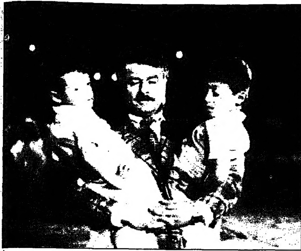
لفتة من فيلم نجوم النهار

في ندوة نظمتها للجمع الثقافي بابو ظبي على هامش اسبوع السينما السورية قال للمخرج السوري اسامة محمد ان السينما